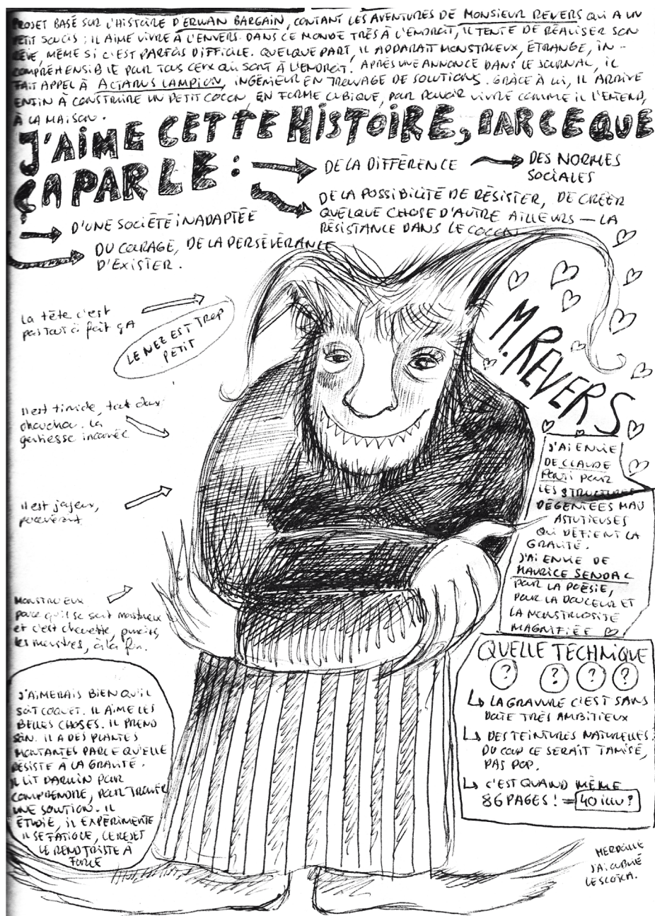
Recherche de personnage Monsieur Revers Croquis, Azul Joliat, 2026

Elles déplacent ainsi la narration : le personnage n'est plus donné comme une évidence, il se construit progressivement, à travers des variations, des tentatives et des écarts visibles dans le dessin.