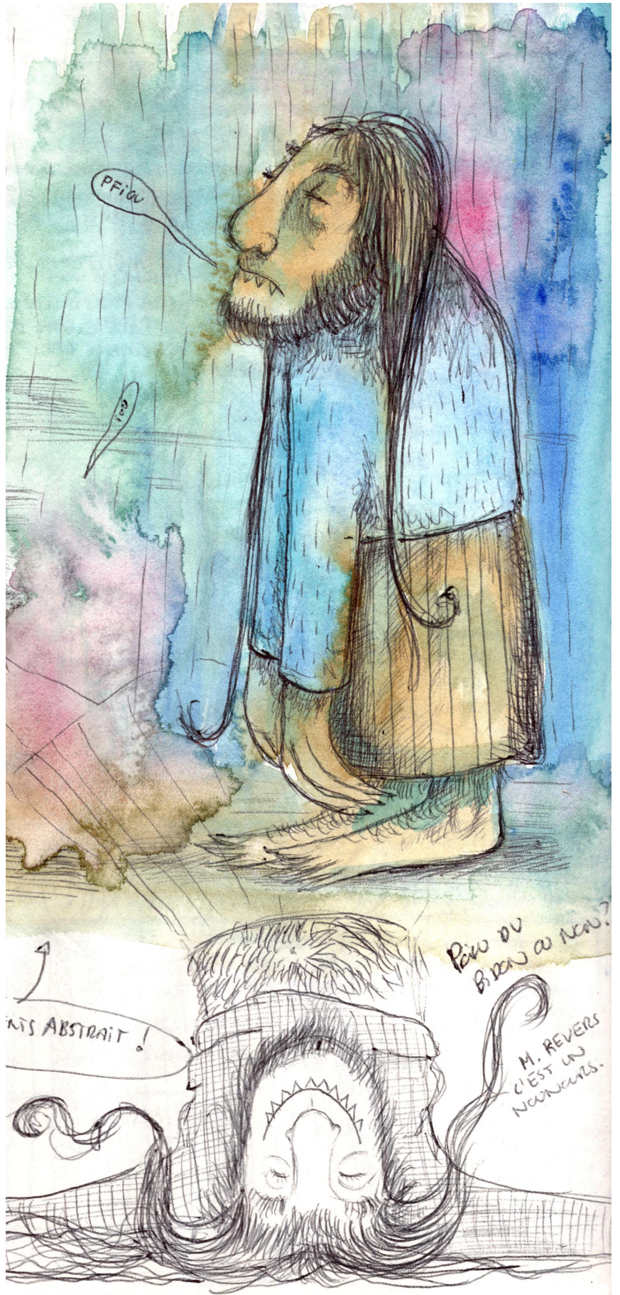
Recherche de personnage Monsieur Revers Croquis, Azul Joliat, 2026